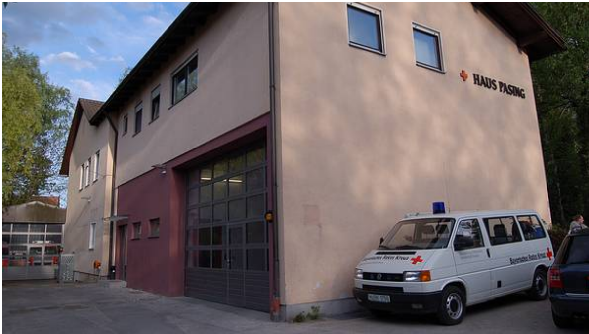
links Eingang zur Rettungswache; rechts um die Ecke: Eingang Bereitschaft

Mit der Renovierung der Rettungswache Pasing, die mit uns im Haus ist, gab es auch eine neue Garage bzw. Stellplätze für unsere Einsatzfahrzeuge.